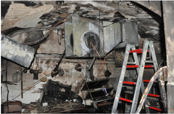
Küchenbrand, Altöttinger Hof