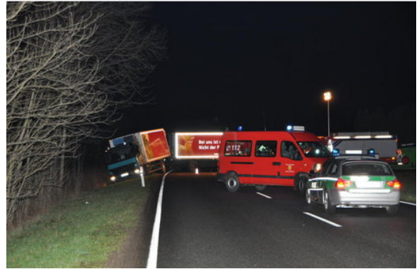
LKW im Graben, ehem. B12 (Stadel)